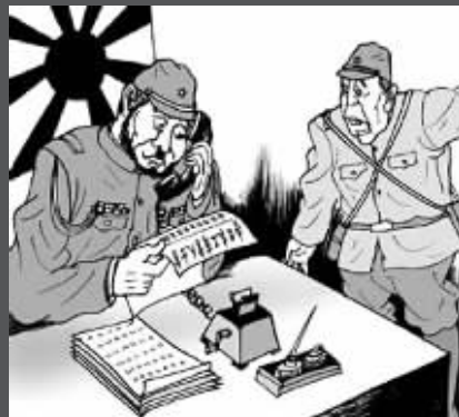
看到传单日本军官惊恐不已。