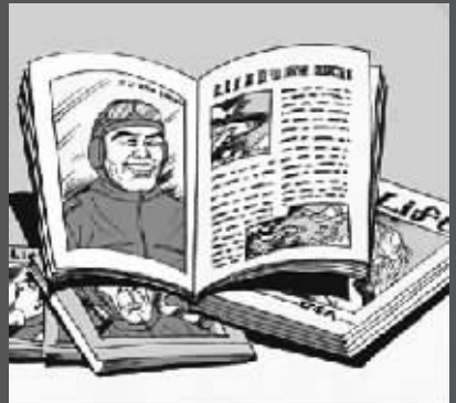
美国的《生活》称徐焕生是“轰炸日本本土的第一人”。