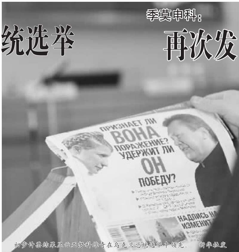
初步计票结果显示亚努科维奇在乌克兰总统选举中领先。